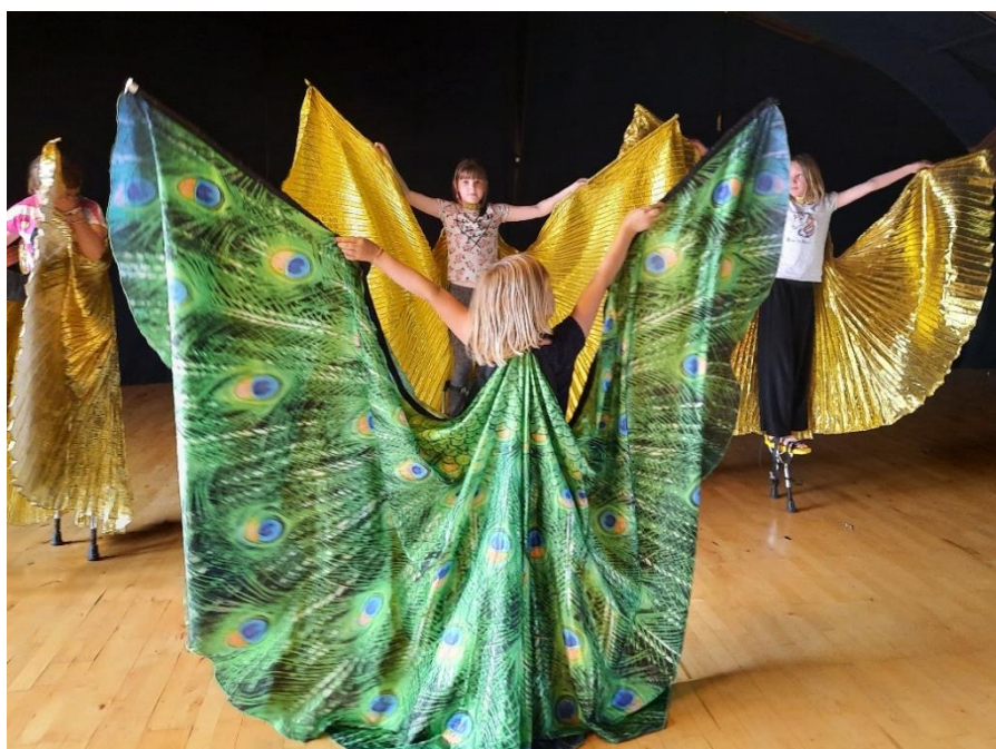
Dragedans på stylder