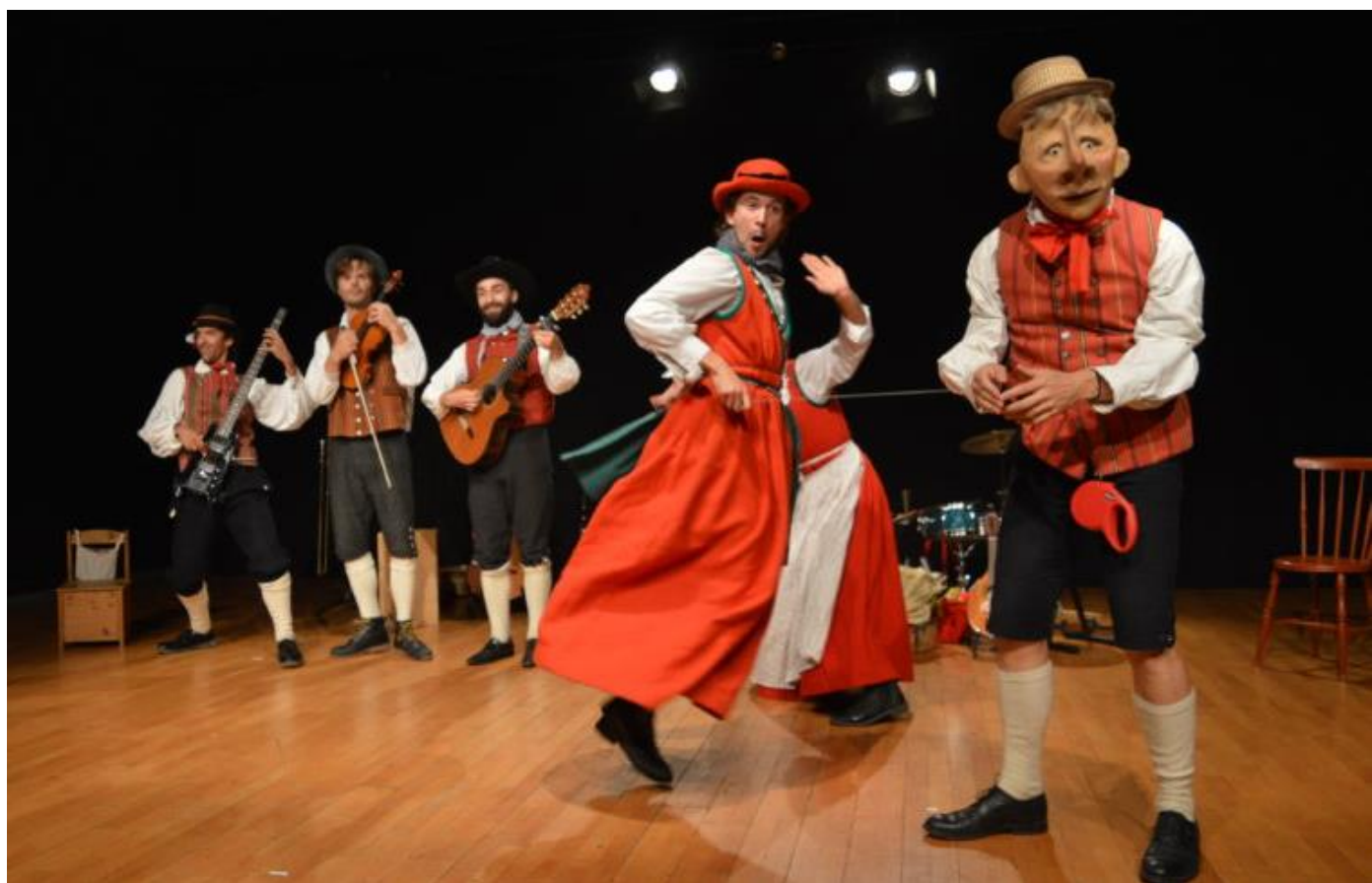
Stadsmusikanterne fra Bremen med Ikarus