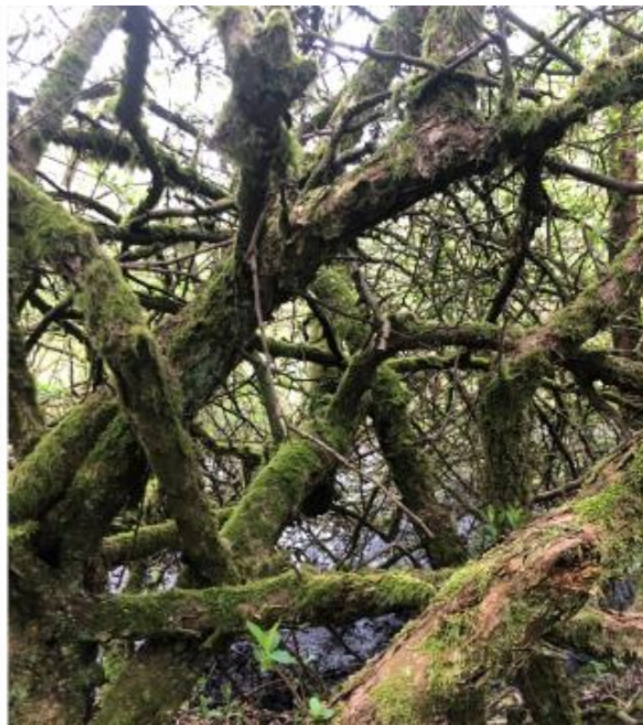
Uddrag fra Antonella Dianas scenografiske research og skitser