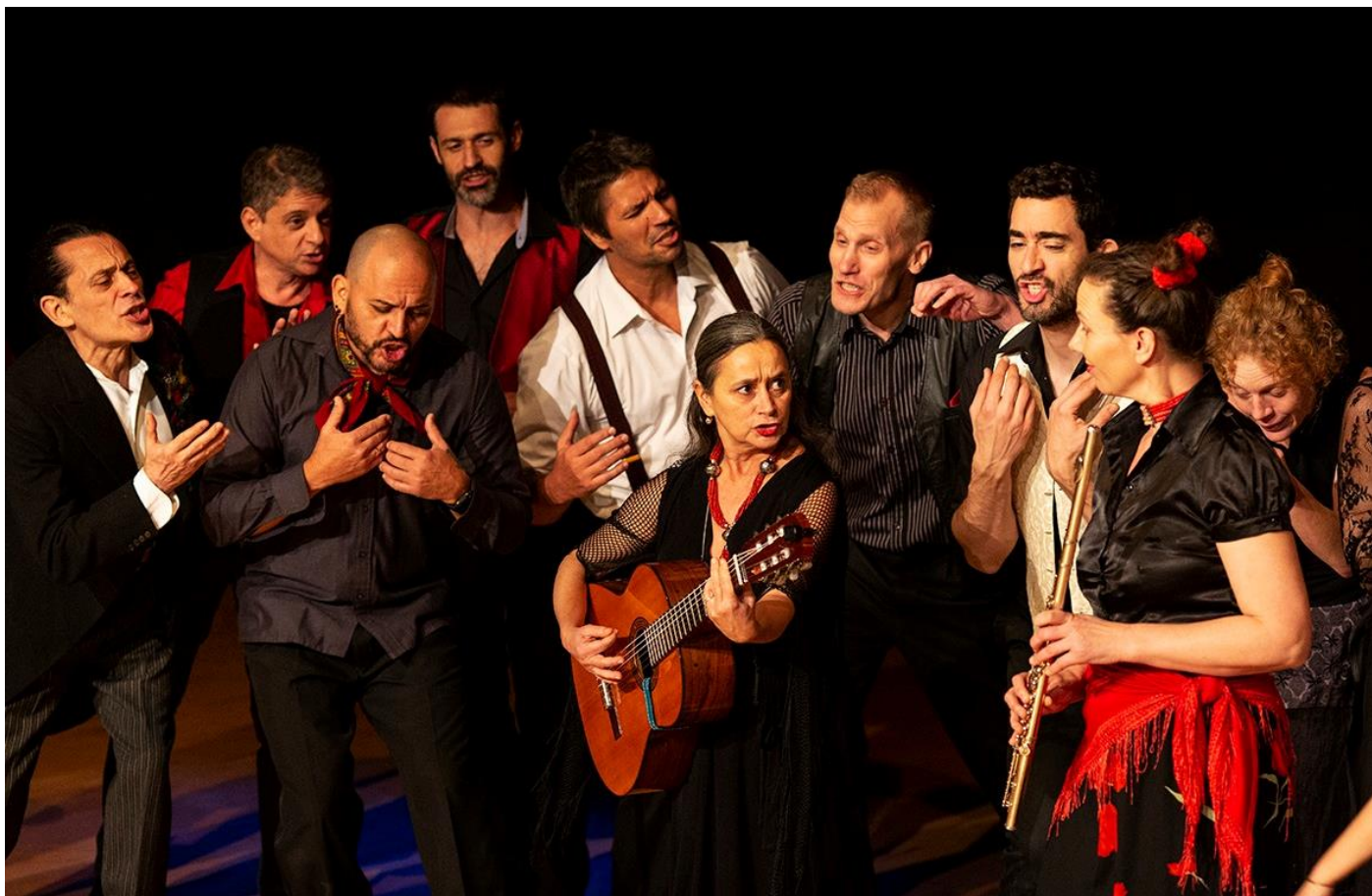
Vindenes Bro på Teatret OM