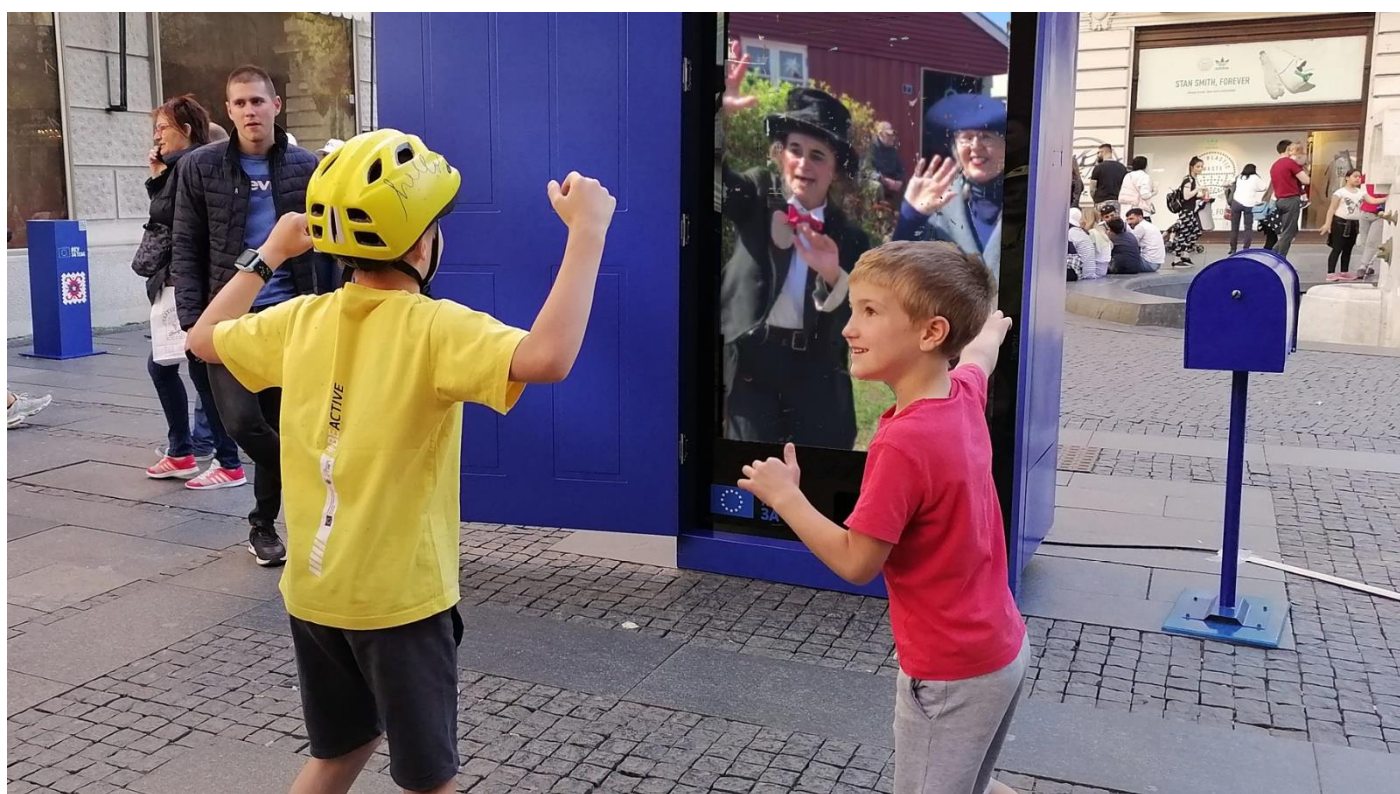
Børn på en plads i Beograd ser Teatret OMs optrin på Ringkøbing Havn og interagerer med klovnen Spugna.