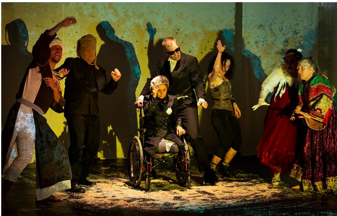
Prøve på forestillingen Freaks

Vindenes Bro er ledet af Iben Nagel Rasmussen. Gruppen tæller 26 medlemmer fra hele verden, der typisk mødes en gang om året og arbejder sammen i 3 uger. Teatret OMs faste kerne - og mange af vores tilbagevendende samarbejdspartnere - har været medlemmer i årtier.